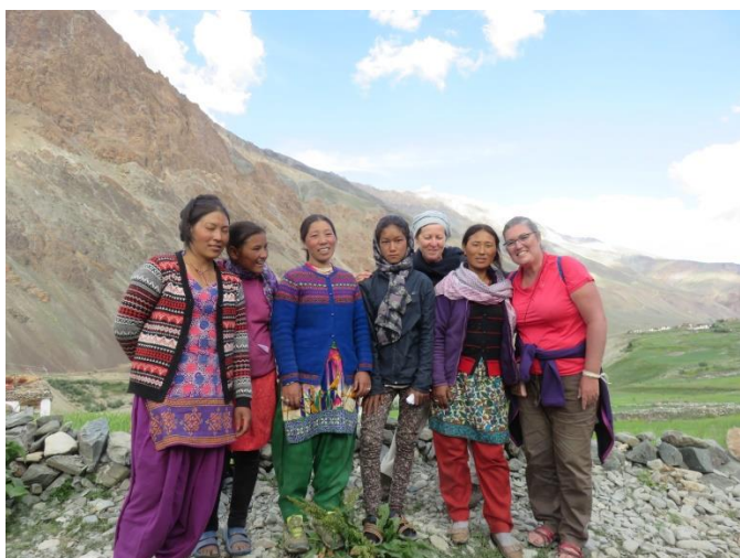
Une partie des femmes de l'association des villages de Kuru, Testa et Marling