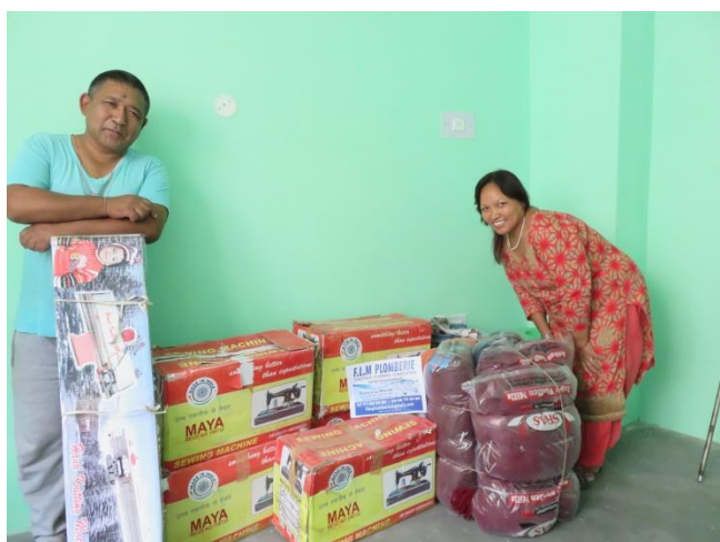
Machine à tricoter, machines à coudre et laine que nous donnerons lors de notre voyage

Ces actions ont été menées à bien au mois de Juillet 2017, nous vous présentons le résultat de chacune d'elles.