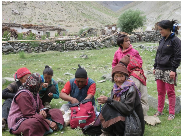
Consultation en plein air au village de Testa

Le pouls est pris, le déséquilibre déterminé, il ne reste que le choix des médicaments