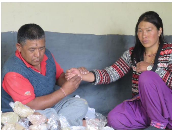
Prise de pouls lors d'une consultation de médecine traditionnelle tibétaine au village de Kuru