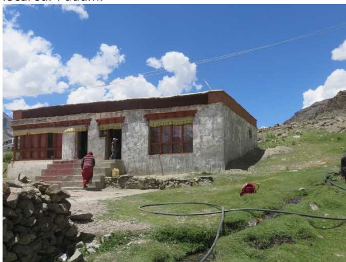
La nonnerie de Manda