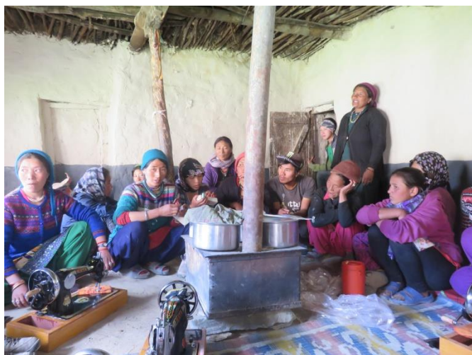
L'atelier de couture