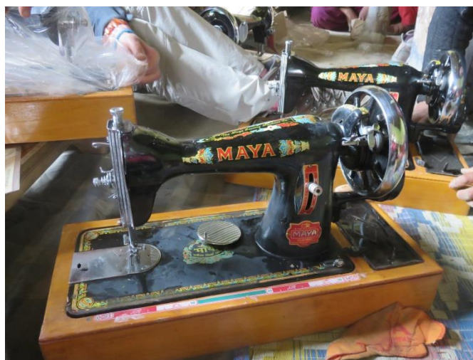
Machine à coudre manuelle