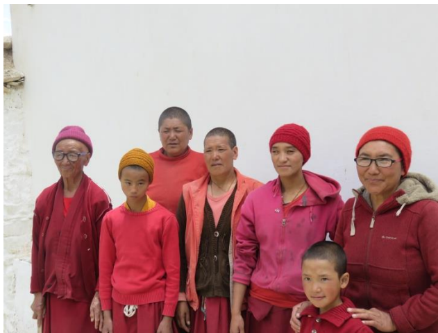
Les nonnes de Zangla sont environ 20, et ont toujours le sourire malgré les difficultés de leur vie.