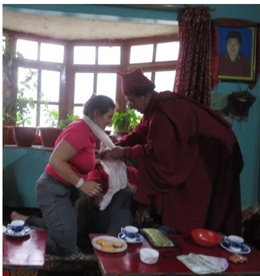
Une nonne de Pishu remet une katak en signe de remerciement