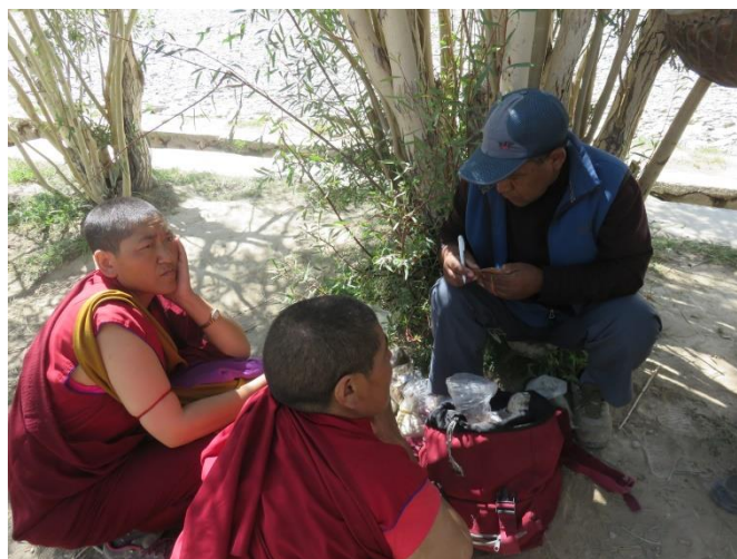
Rencontre avec les nonnes de Skagyam au palace du dalaï-lama

La nonnerie de Zangla utilisera l'argent pour refaire la salle de prières qui s'est effondrée suite aux importantes pluies de cet hiver. Les murs en pisé (boue séchée), résistent de plus en plus mal au changement climatique qui se fait beaucoup sentir dans cette région, sous la forme de précipitations au-dessus de la moyenne habituelle. Une vingtaine d'enfants de moins de 16 ans sont scolarisés dans cette nonnerie.