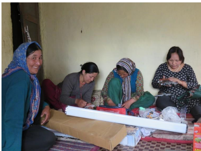
Montage de la machine à tricoter