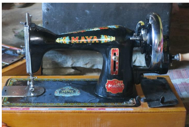
Une machine à coudre non électrique

En Décembre 2017, elles ont créé leur association dénommée « Self Help ». Nous avons beaucoup apprécié le nom, dans la ligne directe de notre philosophie d'action.