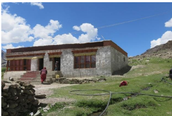
La nonnerie de Manda, où vit une vingtaine de nonnes

Une aide de 200 euros par nonnerie (14 000 roupies) permet l'achat de riz pour 2 mois pour une communauté de 20 personnes.