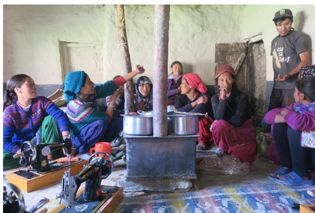
Les femmes de l'association dans la pièce qui leur sert d'atelier à Kuru

Cette année, elles nous ont demandé de les aider pour la confection d'une machine à tisser des tapis, qui sera réalisée par le charpentier local.