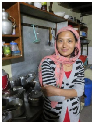
La gouvernante de l'internat, dans la cuisine.

Possédant 16 places, il ne peut accueillir que 12 jeunes filles, faute de moyens. Nous avons décidé de l'aider pour la scolarisation de deux pensionnaires supplémentaires.