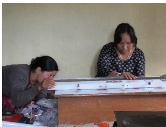
Montage de la machine à tricoter