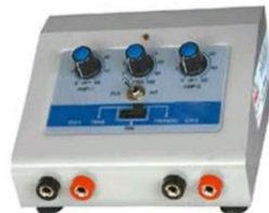
Machines à ultrason (gauche) et simulation musculaire (droite)

Le budget nécessaire à l'achat du matériel de kinésithérapie est de 400 euros, soit 28 000 roupies.