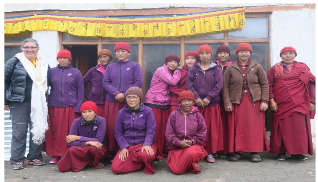
Les nonnes de Skagyam, après un petit déjeuner à 6 heures du matin, à base d'épinards ... excellents au demeurant.