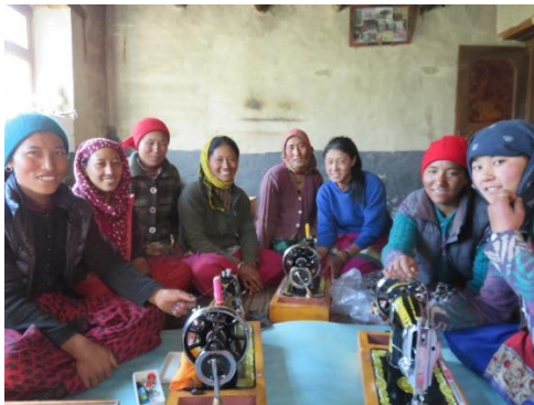
Les 8 jeunes femmes de Tangze