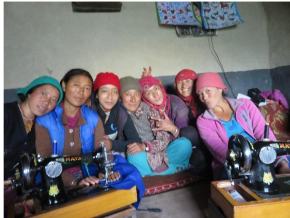
Les femmes de l'association dans la pièce qui leur sert d'atelier à Kuru