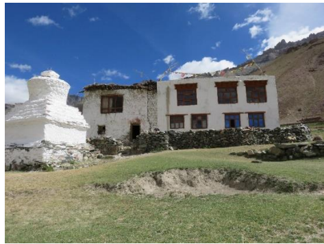
La maison où elles nous ont reçues