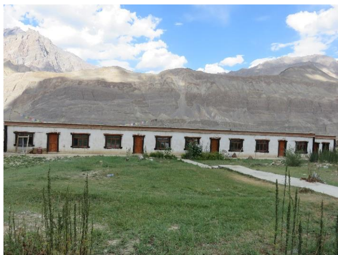
La nonnerie de Pishu, où vit une quinzaine de nonnes. Le bâtiment des cellules, en pisé, est fragilisé par la pluie et requiert une couverture spécifique.

Une aide de 100 à 400 euros selon la taille de la nonnerie (10 000 à 35 000 roupies) permet de compléter le quotidien.