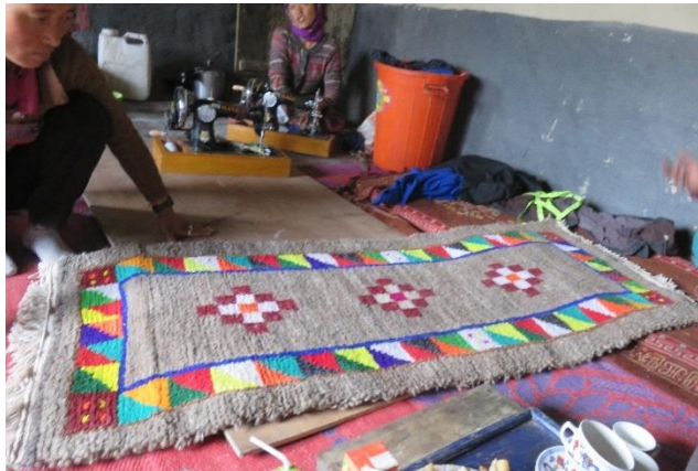
Un tapis confectionné par les femmes de Kuru

Stanzin Lakpa, député de la vallée, finance la construction de la boutique en elle-même. Nous prenons en charge l'équipement intérieur de la boutique, pour un budget de 25 000 roupies, soit environ 300 euros.