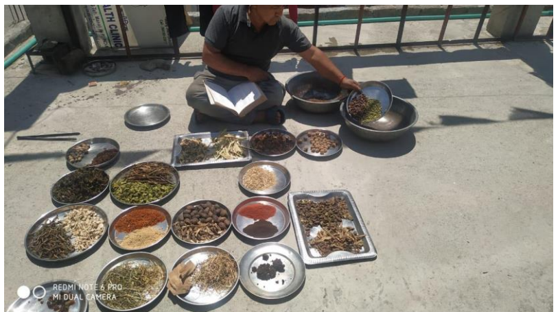
Amchi Lotos soigne les nonnes et les villageois tout au long de la vallée de la Haute Lungnak