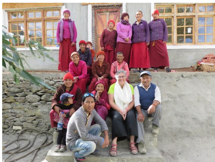
Les nonnes de Skagyam, 20 adultes et 25 enfants, nous ont offert un très bon goûter, fidèles à leur habitude d'accueil. Elles donnent régulièrement de leur nouvelles grâce à WhatsApp.