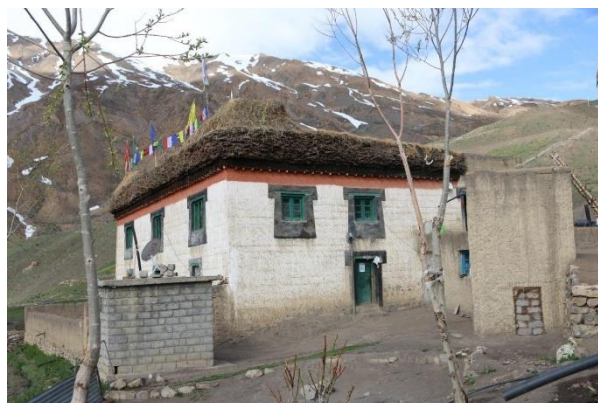
Sa maison dans le village de Chicham au Spiti